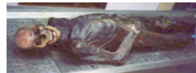
Figura 1. Imagen del caso. Aportada por el Dr. Adolfo Scatena.

La zona donde se encontró el cadáver, la meseta patagónica, tiene un clima seco, caliente y ventoso. No se pudo obtener datos de la temperatura y humedad ambiente del lugar pero, a título ilustrativo, se presentan los datos de un valle vecino, cuyo clima es más húmedo y moderado pero que sirven para tener una idea aproximada de cómo pueden haber sido las condiciones en una zona cercana pero más expuesta, como es el sitio donde fue hallado el cadáver.