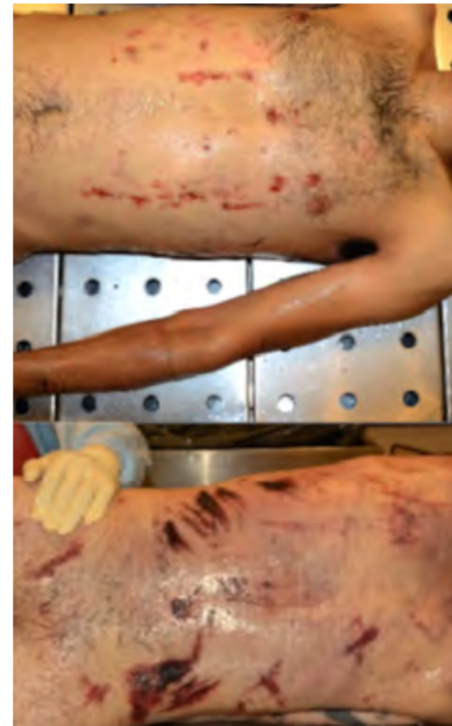
Lesiones en el cuerpo. Imagen del caso.

En el examen externo destacó la presencia de abundante arena gruesa con pequeñas piedras en su boca, sin salida de material hemorrágico por oídos, con rigidez en remisión y cianosis de uñas. Se objetivaron múltiples contuso-excoriaciones, muchas con fondo de piel apergaminada distribuidas en rostro, tórax anterior, posterior y lateral bilateral, en miembros superiores e inferiores.