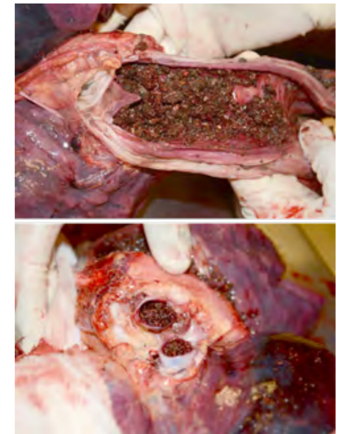
Imágenes de la ocupación completa de la vía aérea y alta digestiva con material arenoso, detalle de la apertura traqueal. Imágenes del caso. Aportadas por el Dr. Gabriel Omar Jerez.

La faringe estaba ocluida por abundante material arenoso y con pequeñas piedras al igual que laringe, trá- quea e incluso las primeras bifurcaciones bronquiales. Esófago con inundación parcial de similar material.